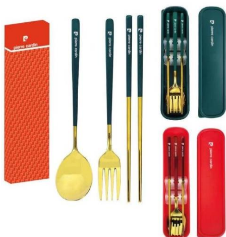
304 不鏽鋼便攜餐具組(10 名)